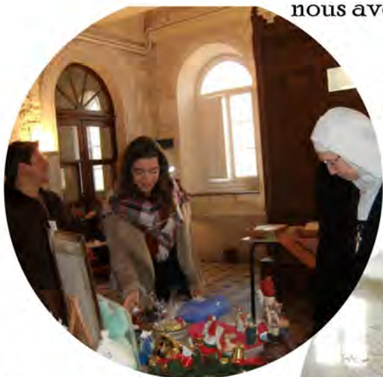
Le marché de Noël

Pendant ce temps, en communauté, nous avons vécu :